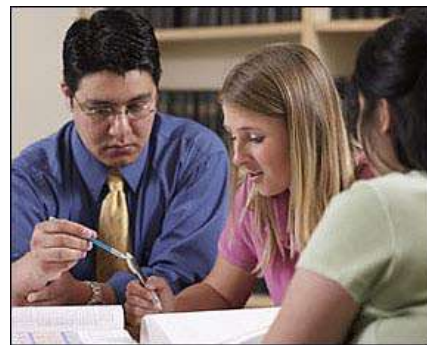
Broj diplomaca iz matematičkih, prirodnih i tehničkih nauka porastao je za 25 odsto od 2000. godine

"Sticanje osnovnih kvalifikacija je prvi korak za učešće u društvu zasnovanom na znanju", napomenula je EK u oktobru. "Međutim, sa 15 godina starosti, oko milion od pet miliona učenika u EU postiže slabe rezultate kada je reč o čitanju i pismenosti."