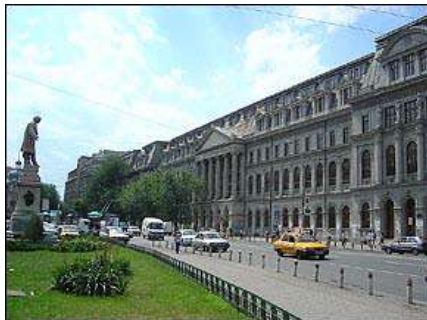
Samo 1,3 odsto radno sposobnog stanovništva u Rumuniji učestvuje u obrazovanju i obuci

Članice EU ostvarile su samo jedan od pet ciljeva u obrazovanju koje je EU postavila do kraja decenije. Napredak u ispunjenju preostalih ciljeva je limitiran, zaključila je Evropska komisija u nedavnom izveštaju.