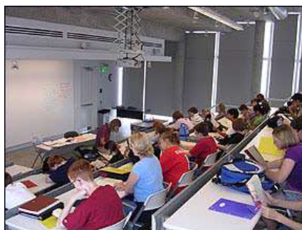
U obrazovanju nema dovoljno jednakosti polova, tvrdi se u izveštaju

Četiri najuspešnije zemlje, kada je reč o polnoj ravnoteži, bile su Estonija, Bugarska, Grčka i Rumunija, u kojima žene čine više od 40 odsto svih diplomaca iz matematičkih, prirodnih i tehničkih nauka. Taj odnos je najviši u zemlji kandidatu za EU članstvo, Makedoniji, sa 46,9 odsto u 2005. godini.