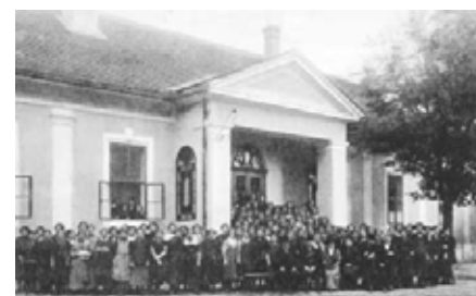
saglasnost na Elaborat o osnivanju Učiteljskog fakulteta u Somboru;