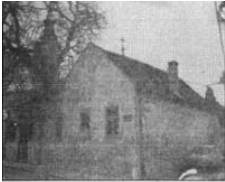
Prva srpska škola u Zemunu, Njegoševa 45