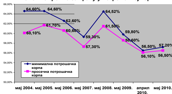
Учешће трошка за храну у потрошачкој корпи

Međutim, svako od nas, pa makar on bio i statističar, gleda samo ono što ga interesuje. To je mali broj proizvoda u odnosu na sve ono što ulazi u potrošačku korpu. Pri tom ne pričamo o uslugama i proizvodima koji se ne kupuju u prodavnici, koje potrošač obično ne vidi. Dakle, svako ima neku svoju potrošačku korpu i gleda svoju muku. Ipak na zvaničnu statistiku Ministarstva trgovine svakog meseca reaguju brojne organizacije za zaštitu kupaca. Tako npr. iz Nacionalne organizacije potrošača Srbije mesecima poručuju da su takvu korpu krojili nutricionisti, a ne ekonomisti i da je umesto zvaničnih nešto manje od 38.000 dinara, prosečnoj četvoročlanoj porodici za preživljavanje potreban dvostruko veći iznos.