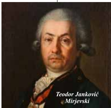
Teodor Janković Mirjevski