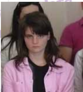
grupa vaspitača i učenika SOSO „Yuk Karadžić” sa domom Sombor