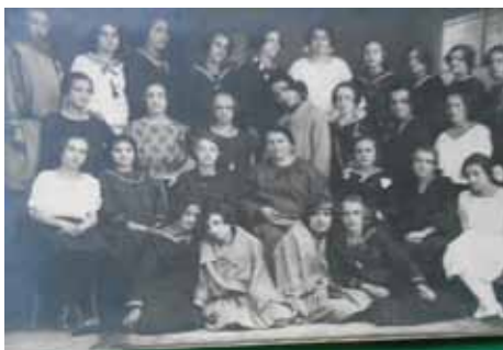
III RAZRED ŽENSKE UČITELJSKE ŠKOLE