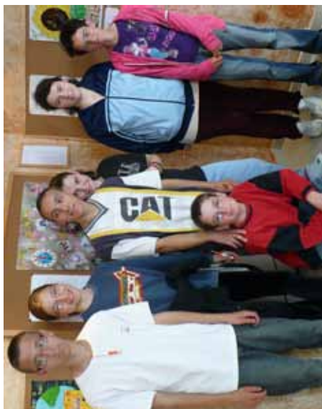
II mesto Grupa dece iz ŠOSO sa domom „Vuk Karadžić“ Sombor mentor vaspitna služba ŠOSO sa domom